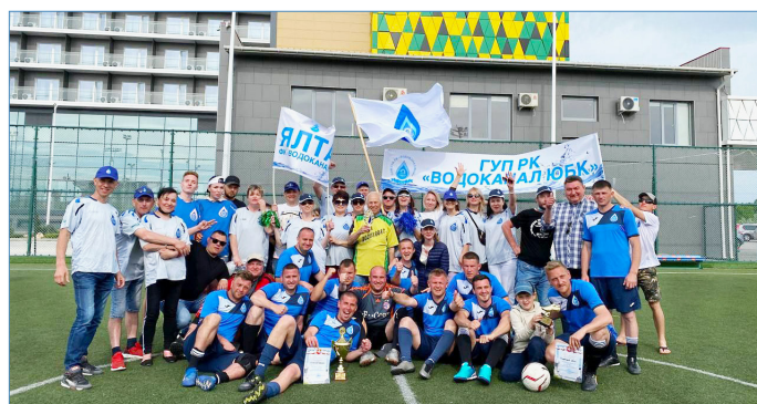
Футбольный турнир Евпатория 2021 г.