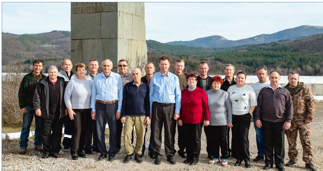
Сотрудники Счастливенского гидроузла